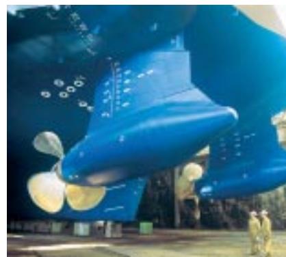
ABB: Schiffsschrauben und Turbinen.

ABB, der schon fast schon tot geglaubte schwedisch-schweizerische Technologiekonzern, hat punkto Wertschöpfung im Jahre 2003 beachtlich abgeschnitten: