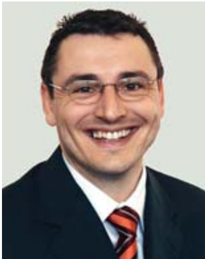
Von Pius Zraggen

OLZ, ein Spin-off der Universität Bern, arbeitet als Finanzintermediär u.a. mit UBS als Partner. Die Anlagegrundsätze der OLZ lauten: diversifizieren, optimieren und Kosten minimieren.